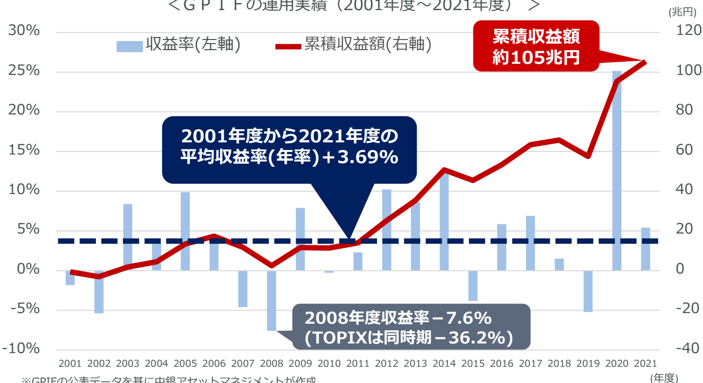
<GPIFの運用実績（2001年度～2021年度）>